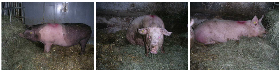
Slika 3: Prašiči pri žretju otave v različnih položajih

Dvakrat dnevno (okrog 8 h in 14 h) smo v hlevu na višini 65 cm merili temperaturo in relativno vlago. Povprečna temperatura je bila v času opazovanj 6.5 °C in relativna vlaga 78.8 %. Vir osvetlitve je bila naravna svetloba. Umetno je bil hlev osvetljen le v času krmljenja in opazovanja živali. Kotci so bili različno intenzivno osvetljeni (2 lx – 121 lx), odvisno od vremena, lege kotca v hlevu in genotipa (krškopoljski prašiči so temnejši). Osvetlitev je bila izmerjena z lux-metrom (Voltcraft LX-1108). Vsebnosti plinov, NH 3 , CO 2 in H 2 S, smo tudi izmerili, in sicer s prenosnim detektorjem za pline (X-AM 5000). Vrednosti koncentracij so znašale pod minimalno vrednostjo občutljivosti naprave za posamezen plin.