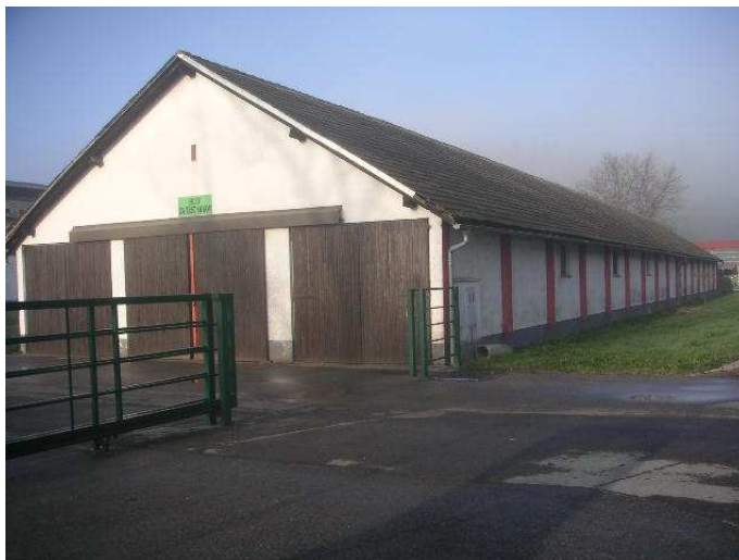
Slika 1: Raziskovalni hlev na Pedagoško-raziskovalnem centru Logatec

počivanje in spanje. Dodatno je služil kot substrat za ovohavanje in ritje, torej material za raziskovanje. Živali so imele na voljo vodo v dveh kapljičnih napajalnikih (58 in 90 cm od tal). Kotci so bili po potrebi očiščeni in na novo nastlani.