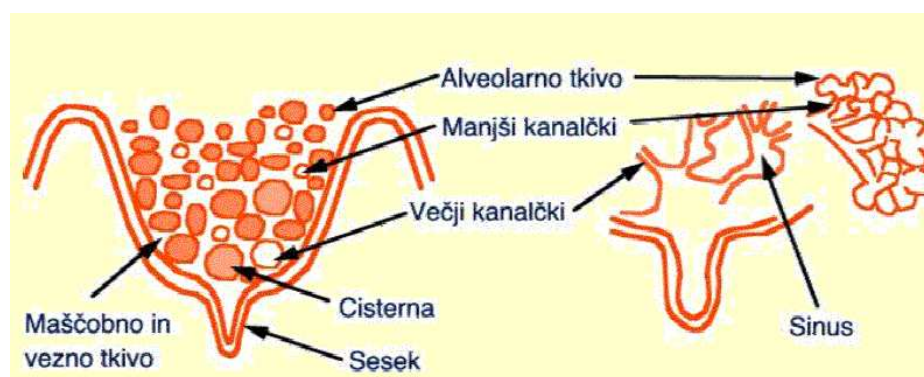
Slika 1: Zgradba vimena

V mlečni žlezi se nahajajo alveole (mlekovotorni mehurčki), kjer se zbira mleko (Baldwin in Plucinski, 1977; Vatovec, 1981). Mleko nastaja v epitelnih celicah, ki tvorijo steno alveol. Alveole so grozdasto sestavljene v režnjiče. Iz njih vodijo mlečni kanalčki, ki se izlivajo v večje mlečne kanale (slika 1). Ti se spajajo v večje odvodne kanale, ki se izlivajo v mlečno cisterno. Ta se deli na žlezni (parenhimski) in seskov (papilarni) del. Na koncu seskovega dela cisterne je seskov kanal, ki ga obkroža in zapira gladka mišica zapiralka. Dobro in popolno zapiranje seskovega kanala omogočajo sluznične gube. Mlečni kanali se razširijo na posameznih mestih v mlečne sinuse ali zatone in imajo razpotegnjeno cilindrično obliko. Mleko, ki se obilno tvori v alveolah, odteka skozi sistem kanalov v cisterno, kjer se kopiči. Do trenutka praznitve ob sesanju ostane seskov kanal zaprt s seskovo zapiralko, ki v normalnih pogojih dovoljuje iztekanje mleka iz cisterne. Po navedbah Rzasa in sod. (2005) je dolžina seskovega kanala pri svinjah 3 do 4 mm.