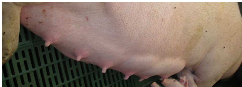
Slika 2: Pravilno razporejeni seski

V našem selekcijskem programu naj bi mladica imela na vsaki strani vimena šest (sedem) enakomerno porazdeljenih seskov, med seboj oddaljenih 6 do 7.5 cm (Kovač in sod., 2005). Ta razdalja omogoča najboljši razvoj mlečne žleze. Seski morajo biti izraziti. Obe liniji morata biti usmerjeni navzdol, da so seski popolnoma dostopni pujskom, ko svinja leži na boku (slika 2). Vime mora biti nastavljeno daleč naprej. Izločamo svinje, ki nimajo izrazitega vimena ali imajo več nepravilnih seskov. Pri maternalnih pasmah tudi pri odbiri merjascev upoštevamo, da naj bi imeli 14 normalno razvitih in enakomerno porazdeljenih seskov (pri pasmi duroc in pietrain 12 seskov). Vime ocenimo ob rojstvu in odbiri, pri svinjah pa tudi v laktaciji tik pred odstavitvijo.