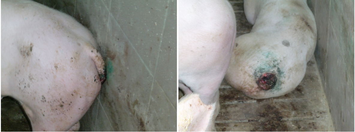
Slika 6: Posledice grizenja repov

Na sliki 6 so vidne resne poškodbe, kar pomeni, da rejec ni bil uspešen pri odkrivanju/preprečevanju grizenja repov. Takoj ko opazimo spremembe moramo iz skupine odstraniti napadalca in žrtev ter preveriti možne vzroke, kot so krma in voda, ventilacija, gostota naselitve, dostopnost materiala za zaposlitev.