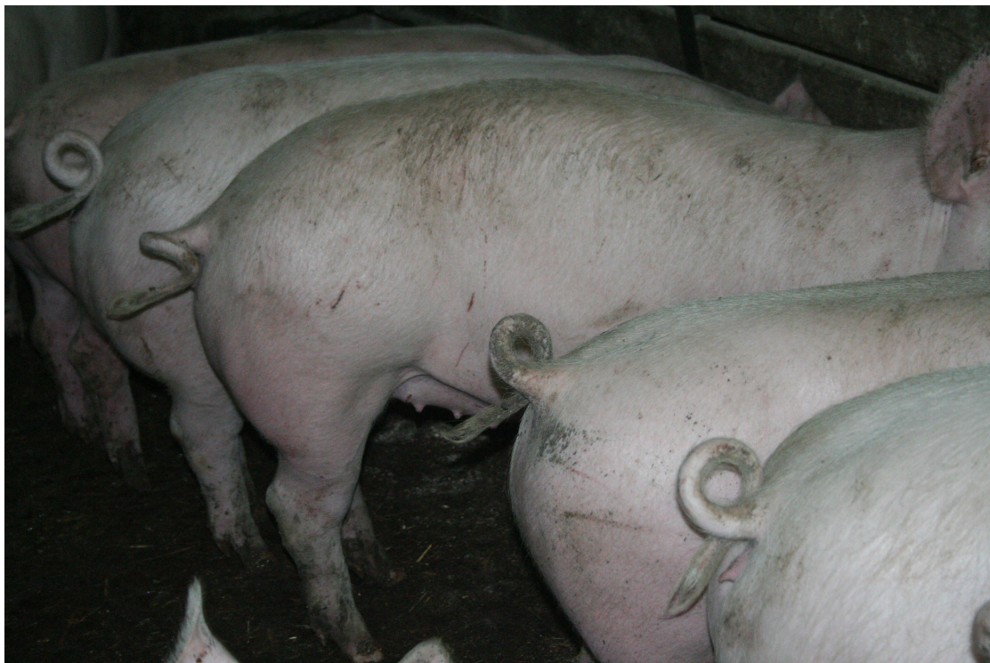
Slika 2: Prašiči z nepoškodovanimi repi