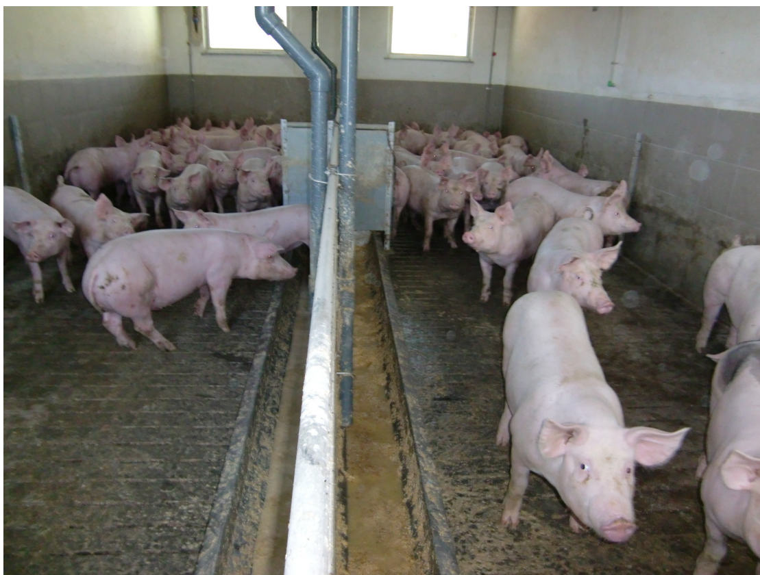
Slika 5: Prašič, v boksu na levi strani, ima spuščeni spodvit rep