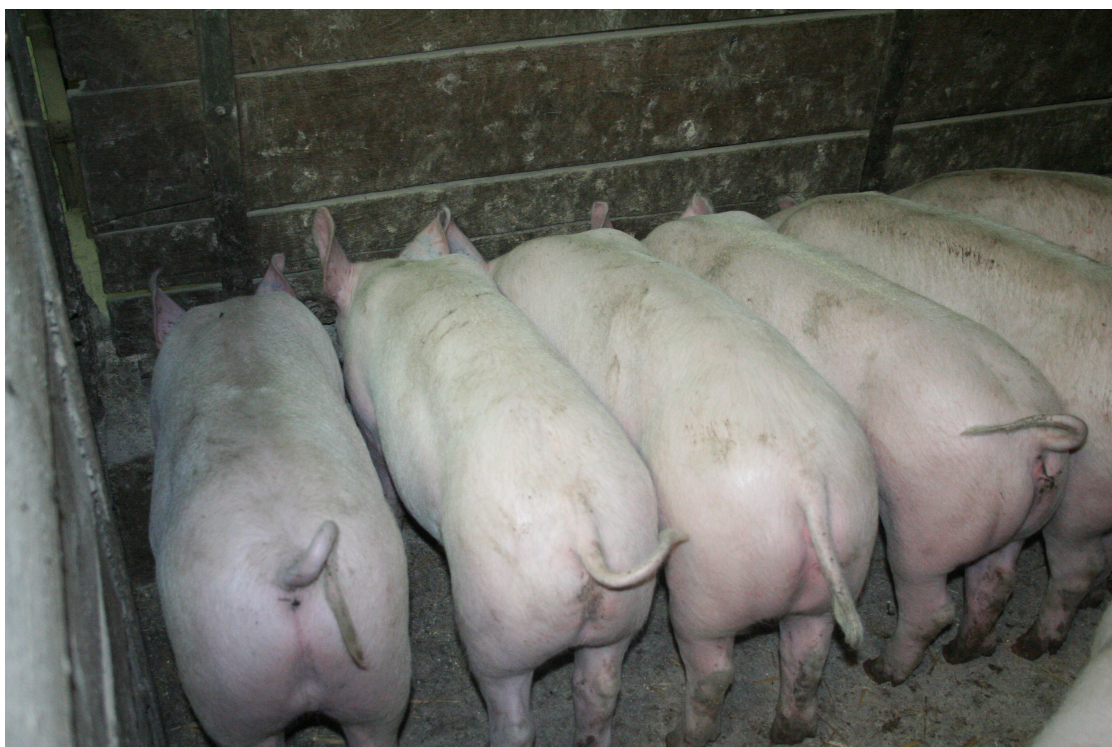
Slika 3: Prašiča na sredini fotografije je potrebno opazovati, če se je pojavilo grizenje repov