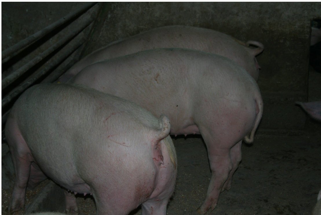
Slika 4: Prašič, na sredini, ima spuščeni spodvit rep, kar se pojavi 1 dan pred grizenjem repov