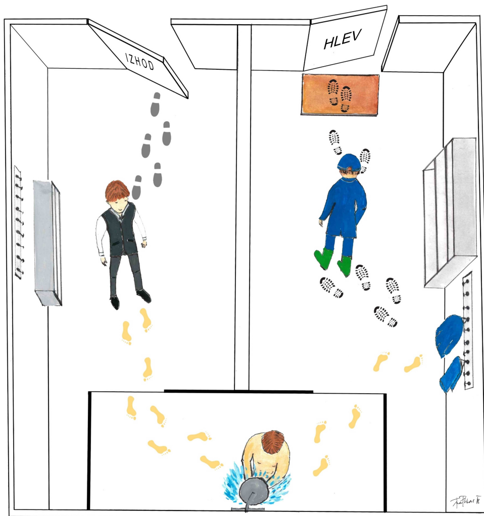
Slika 20: Sanitarni vozle pred vhodom v prašičerejski hlev

pripravljeno oprano obleko in obutev, ki jo uporabljajo samo oni. Uporabljamo različno obleko in obutev znotraj oziroma zunaj farme.