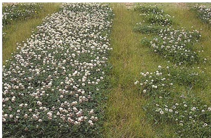
Slika 1: Depresija zaradi inbridinga pri beli detelji: levo neinbridirane, desno inbridirane rastline