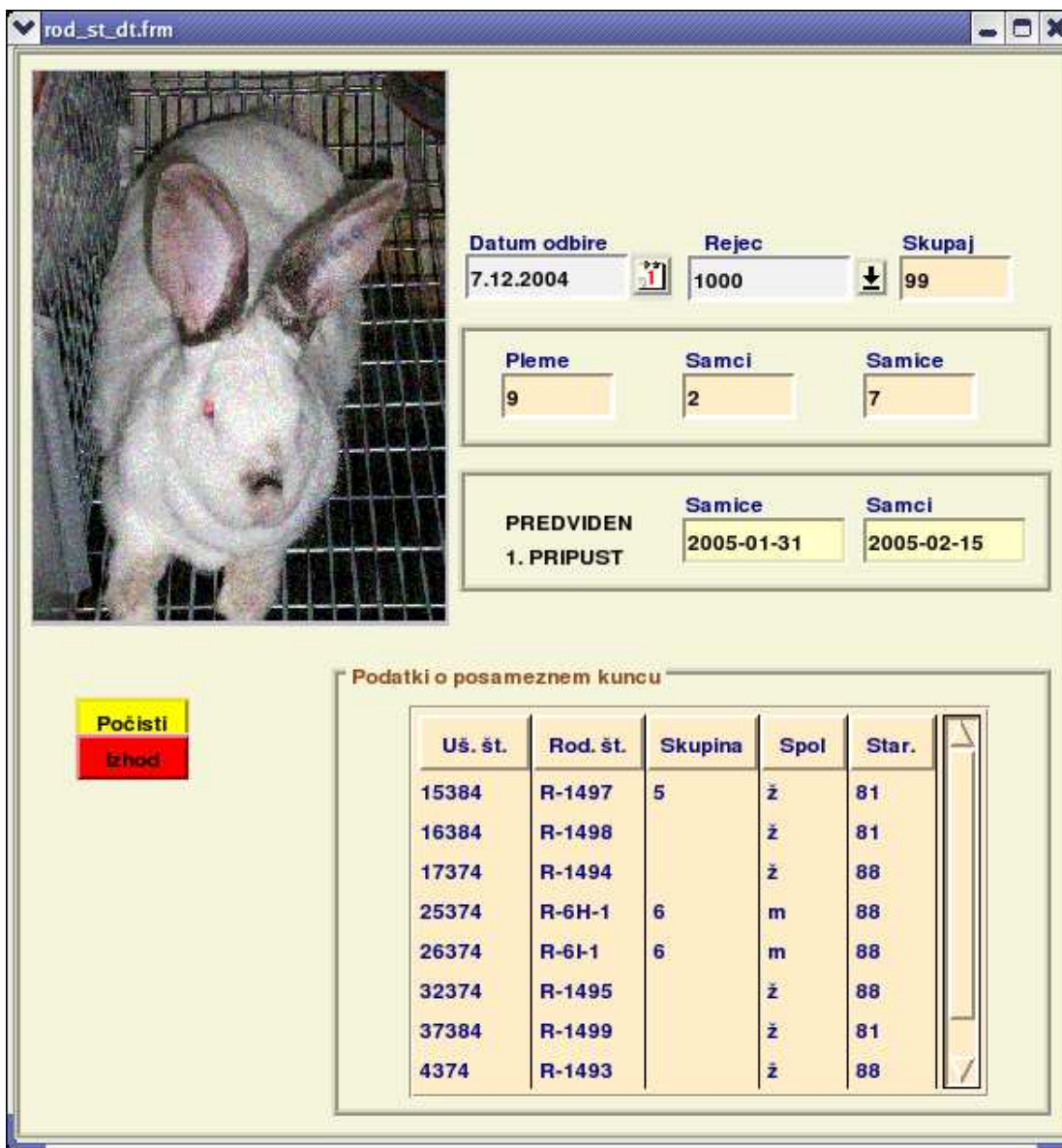
Slika 3: Pregledovalnik za podeljevanje rodovniške številke

Dne 7.12.2004 je bilo pri istem rejcu na odbiri 99 živali (slika 2). Na kunčerejskih obratih odbirajo za tri namene: pleme, prodajo in zakol. Tega dne so 9 mladičev odbrali za pleme, 20 za prodajo, preostale pa bodo zaklali. Pri živalih, odbranih za pleme, je naslednji dogodek prvi pripust. Predvideni datum prvega pripusta pri samicah je 31.1.2005, pri samcih pa 15.2.2005. S seznama pridobimo podatke o posameznem kuncu. Samica z ušesno številko 15384 je bila odbrana za pleme, na odbiri pa je bila stara 81 dni.