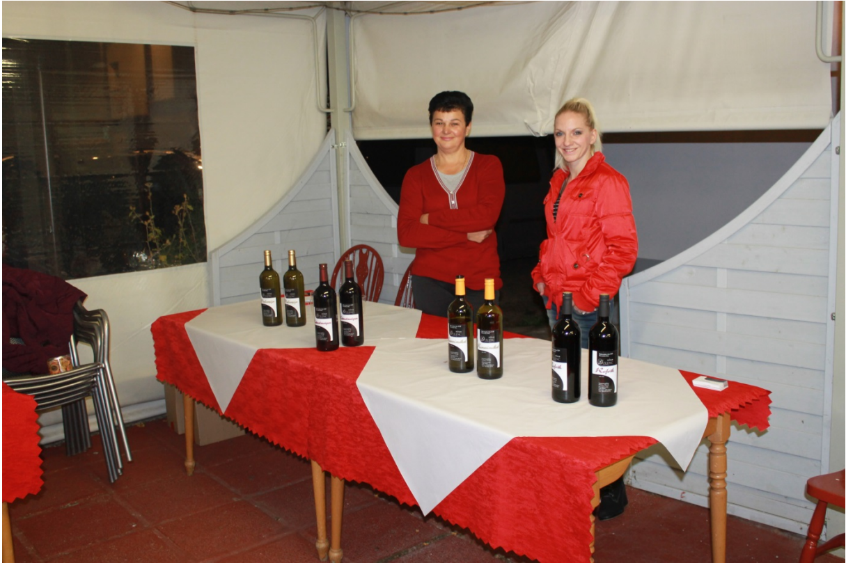
Spremljevalni dogodki: domačini na stojnicah s svojimi izdelki