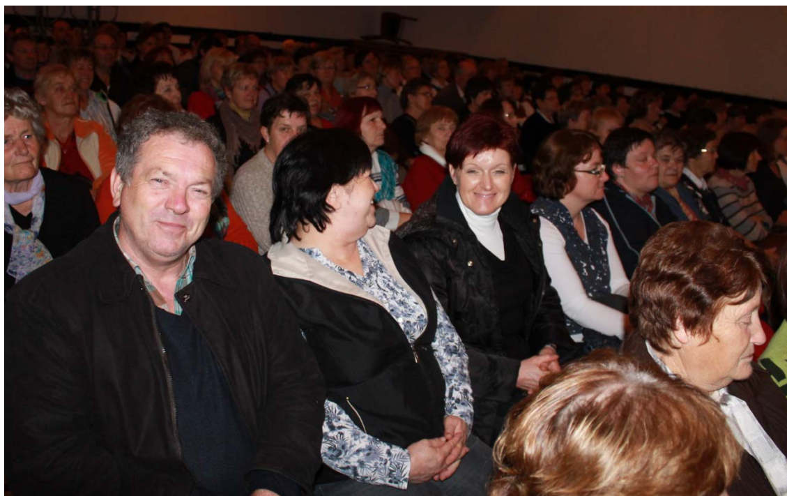
Prijeten občutek ob polni zadovoljni dvorani