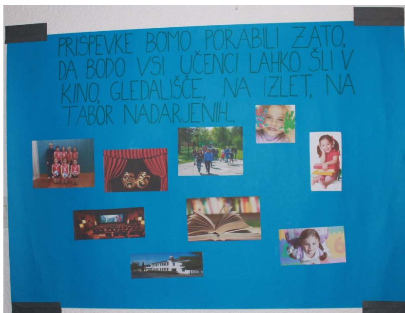
Zbiranje prostovoljnih prispevkov