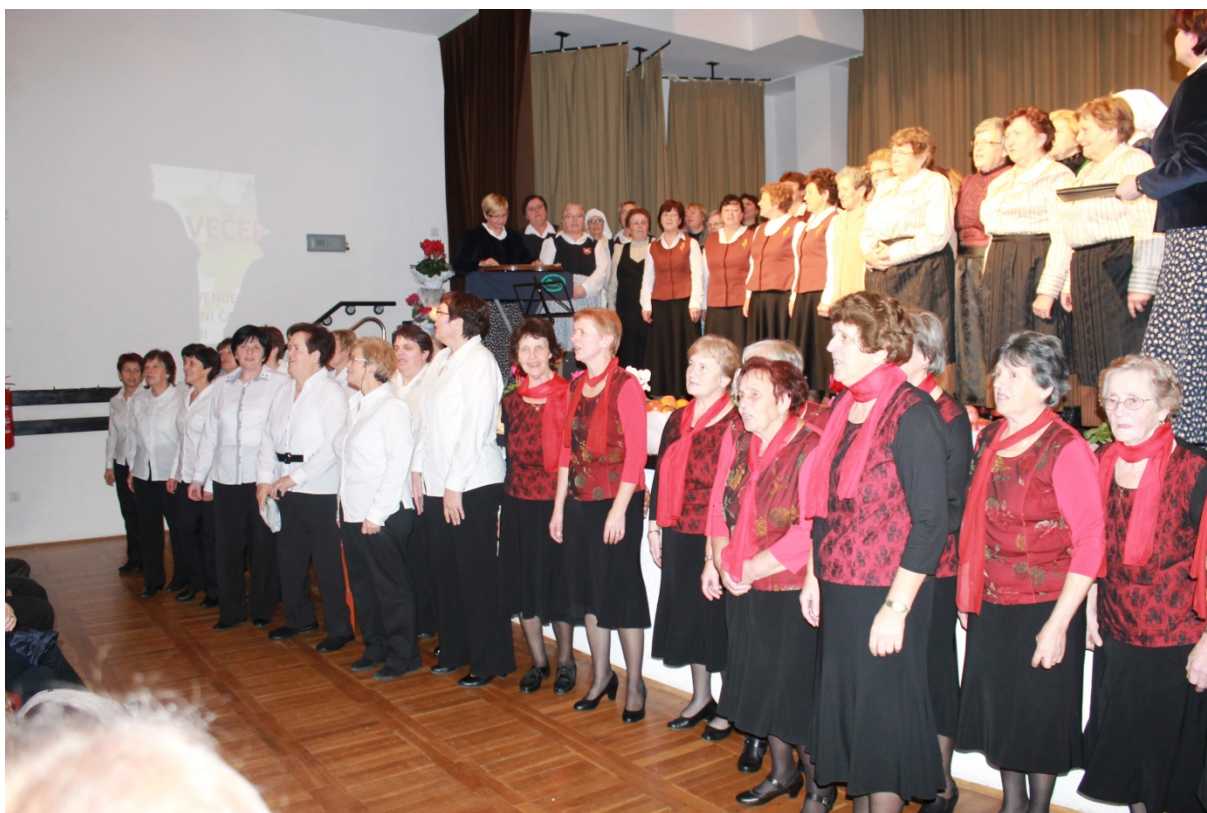
Na odru je bilo premalo prostora za vse nastopajoče