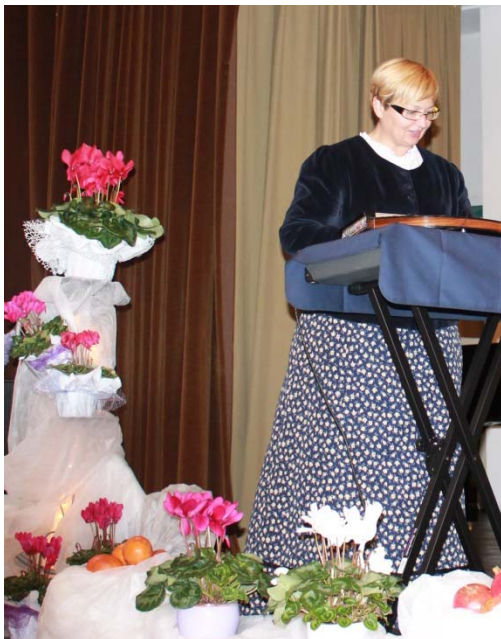
Pevke pevske skupine Klasek Izlake