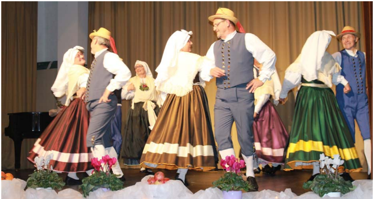
Folklorna skupina Oljka Hrvatini