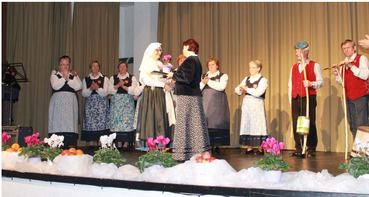
Ljudske pevke in godci Polšnik