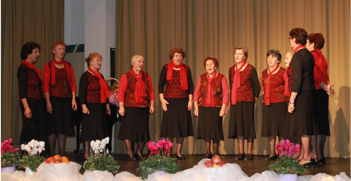
Ljudske pevke Rožce iz Dolenjskih toplic