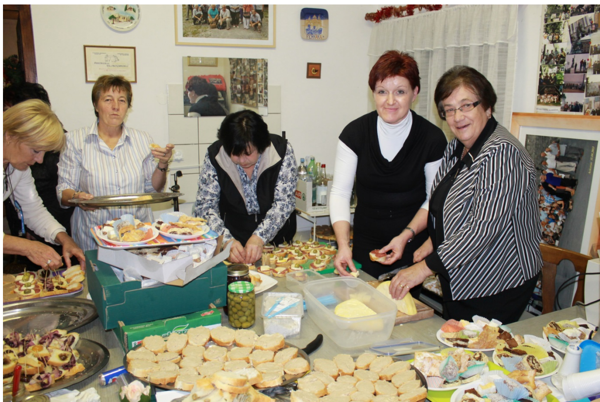
Priprave za družabni del srečanja