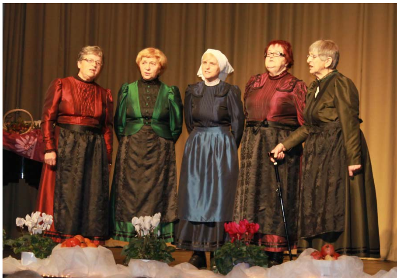
Ljudske pevke iz Skorbe