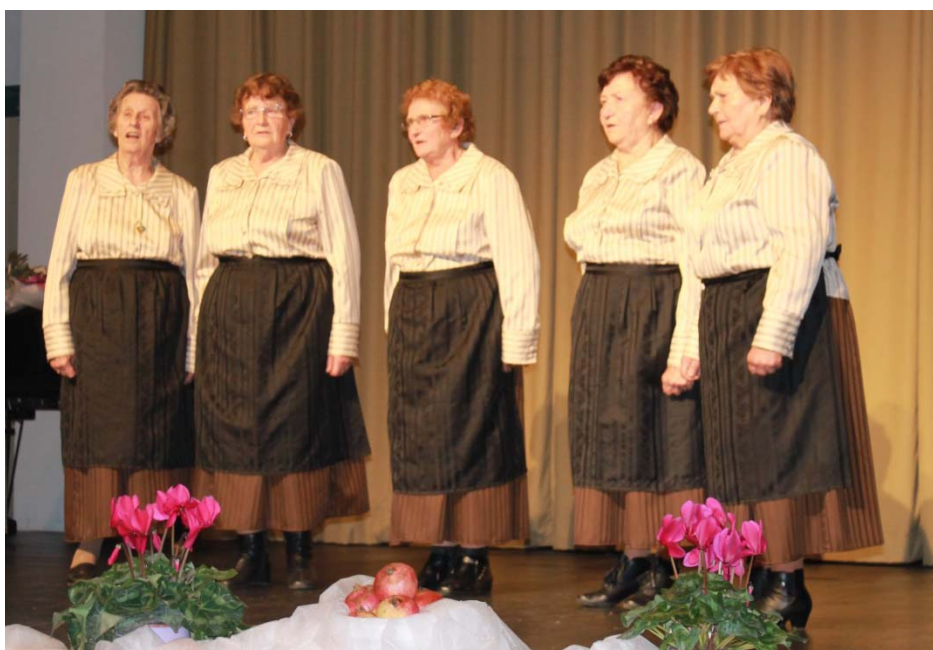
Ljudske pevke Hajdinske frajlice iz Hajdine