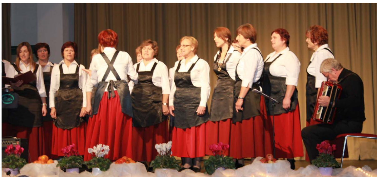
Pevke Društva podeželskih žena Tavžentroža Trebnje, K.O.Trebelno