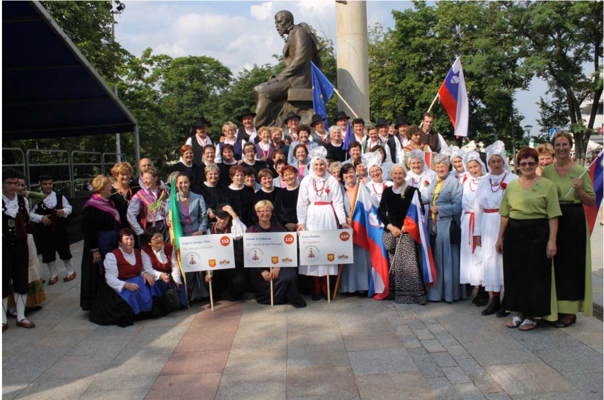
Ob zaključku parade- vse skupine