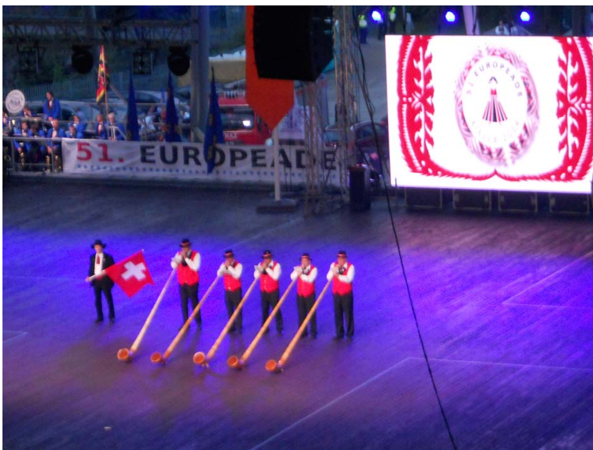
Tile fantje so bili res nekaj posebnega