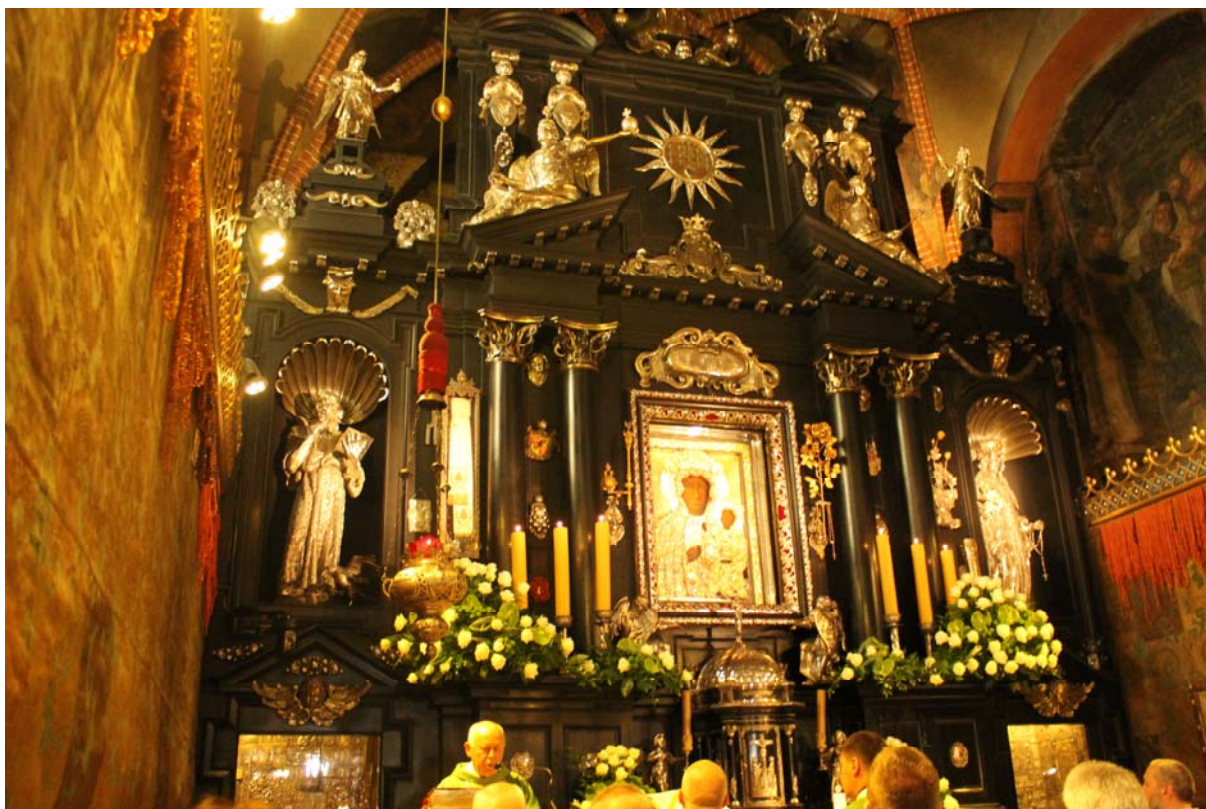
Izlet v romarsko središče