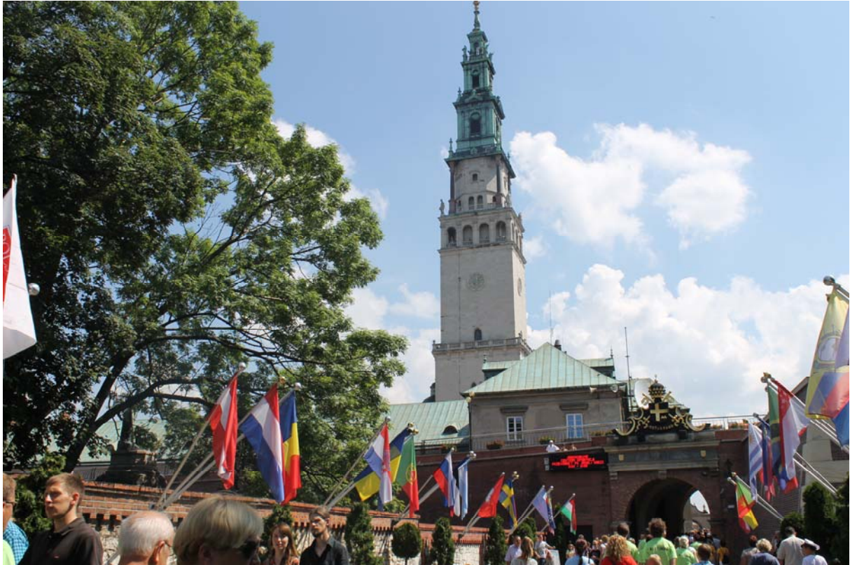
Večer pred odhodom