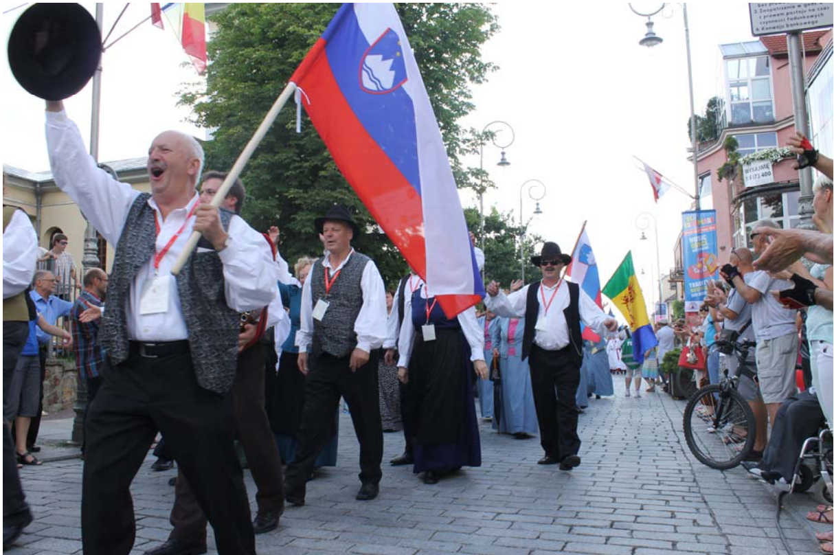
Naše skupine v paradi po ulici