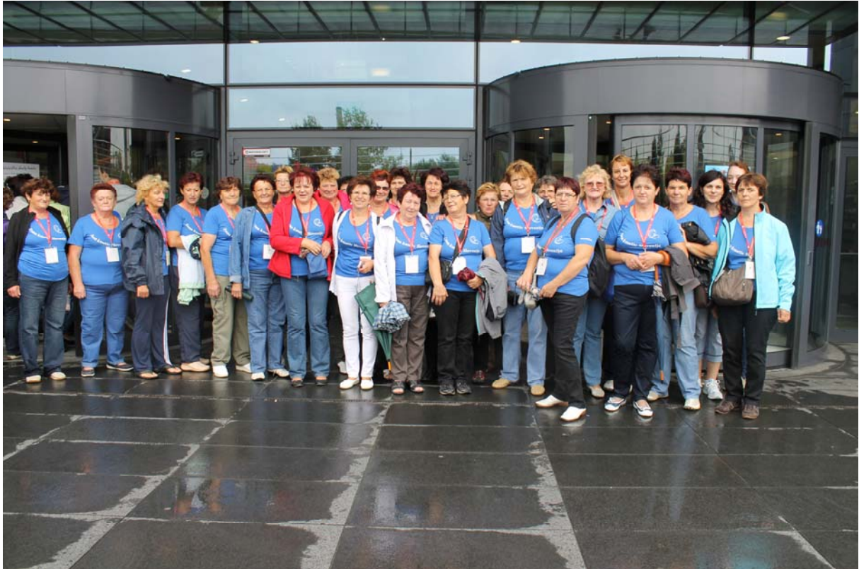
Po sprehodu po dežju, ogled mesta