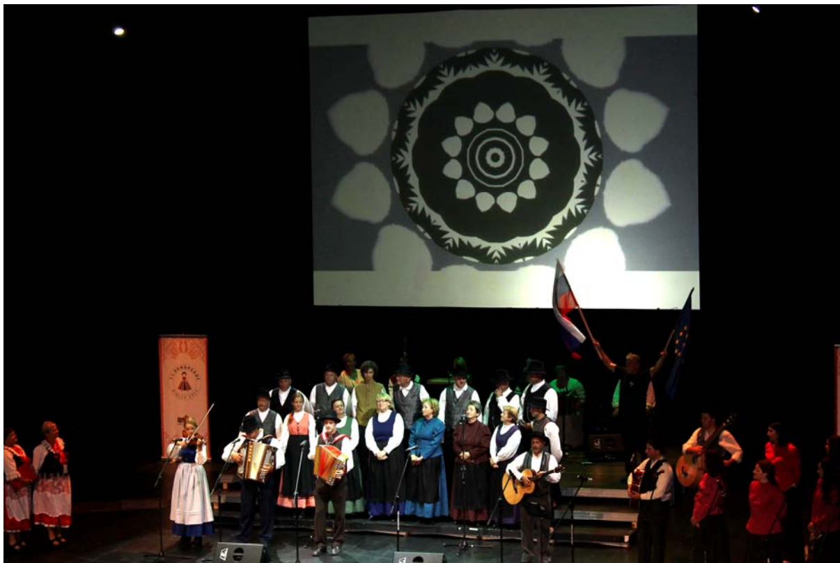
Nastop Fantje z vasi in Zarja v Kulturnem domu