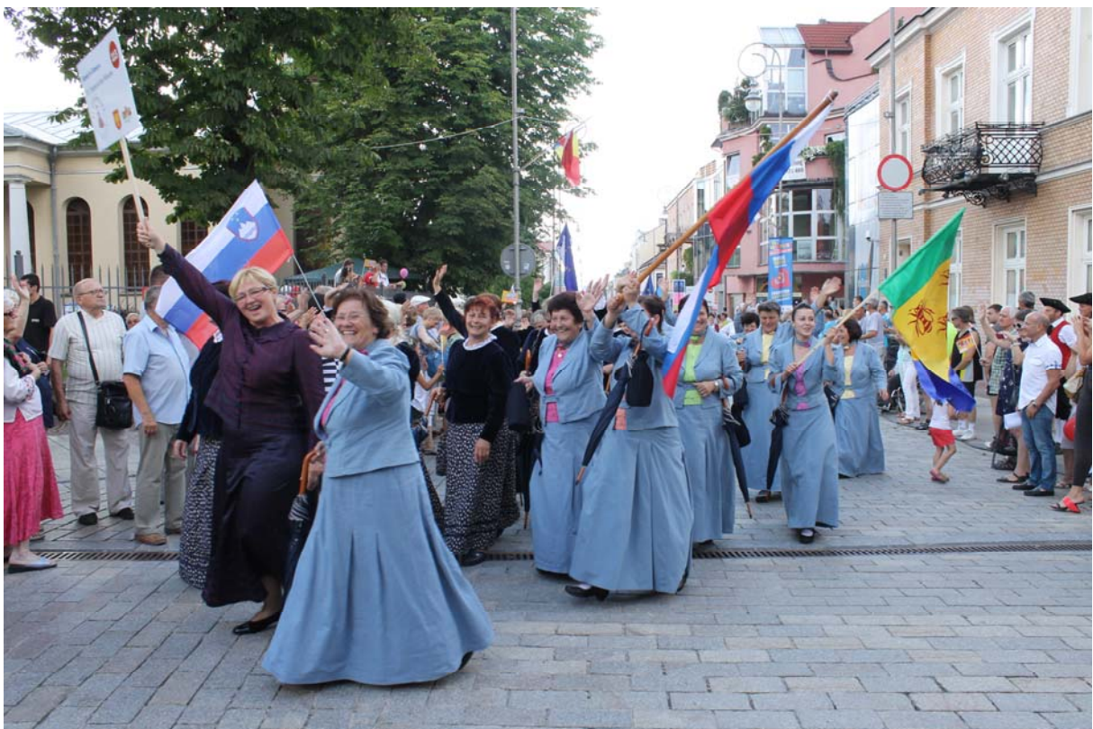
Še malo in prispeli bomo do cilja