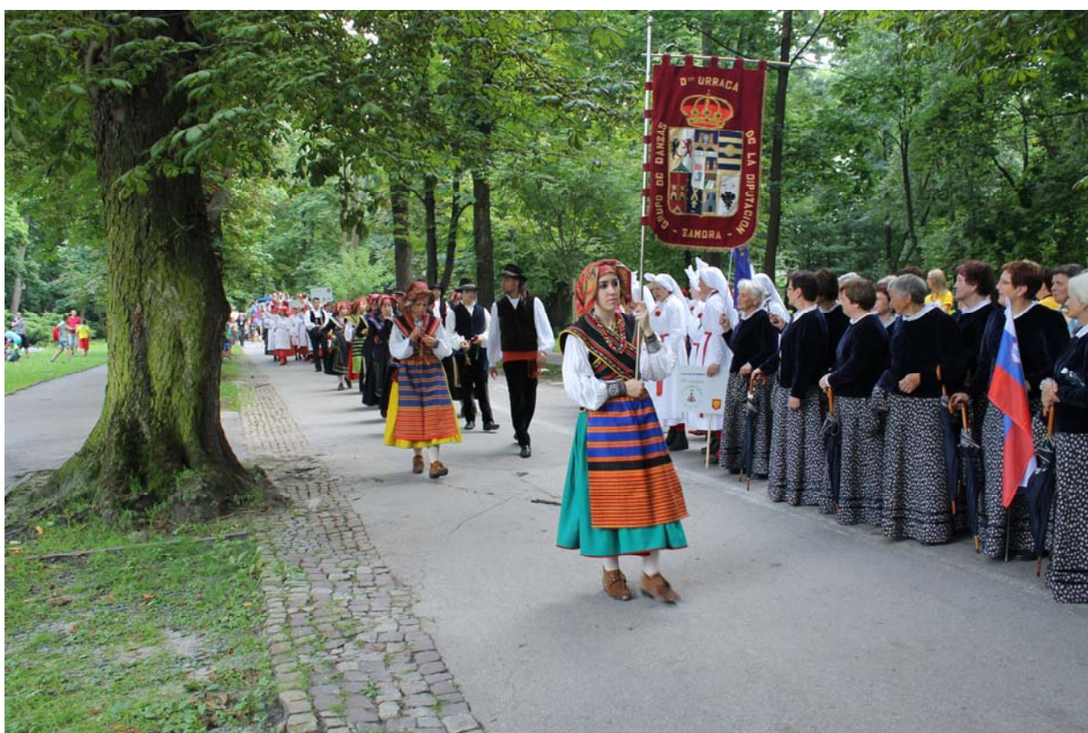
Priprave na parado