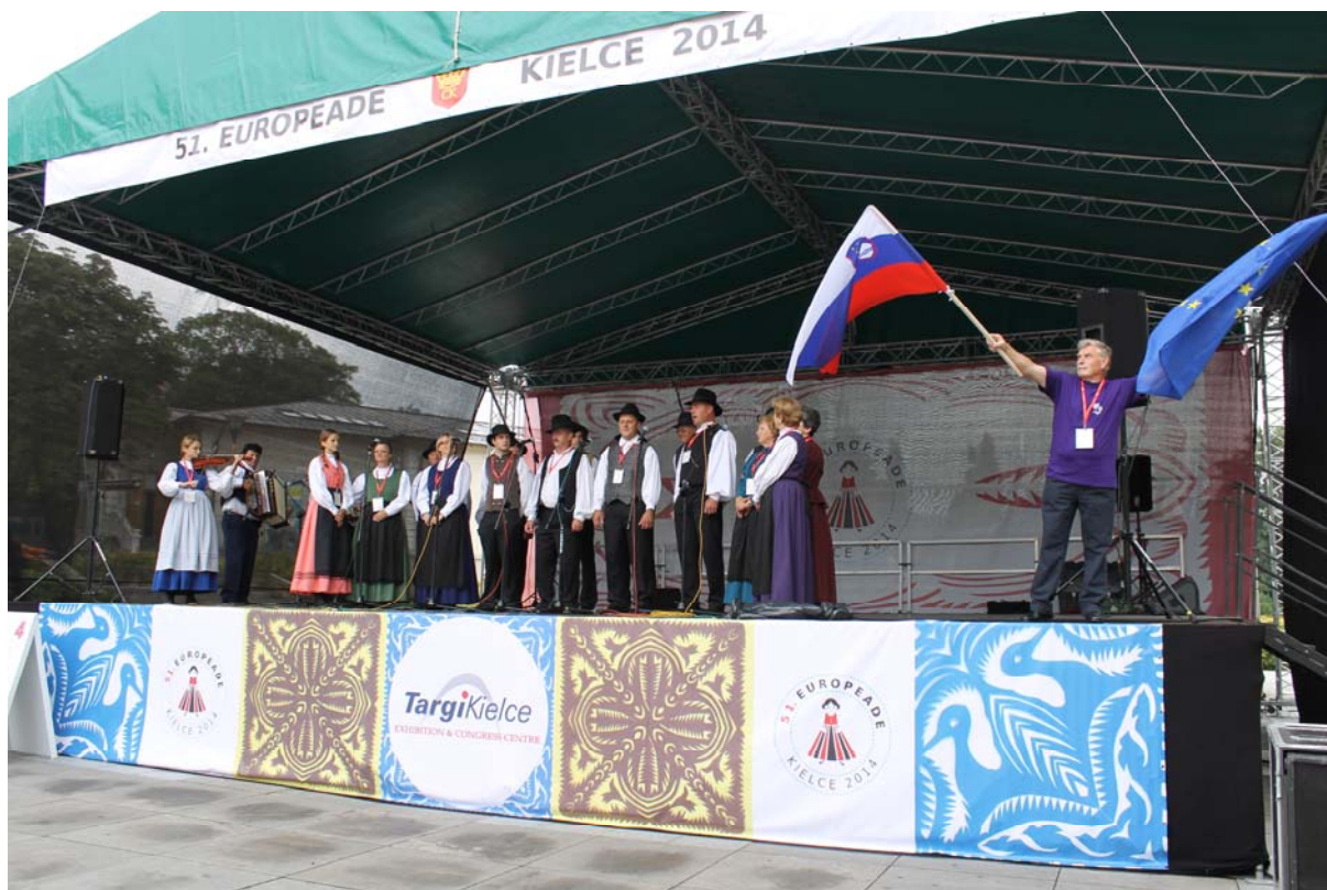
Prvi nastop skupine Fantje z vasi in Zarja