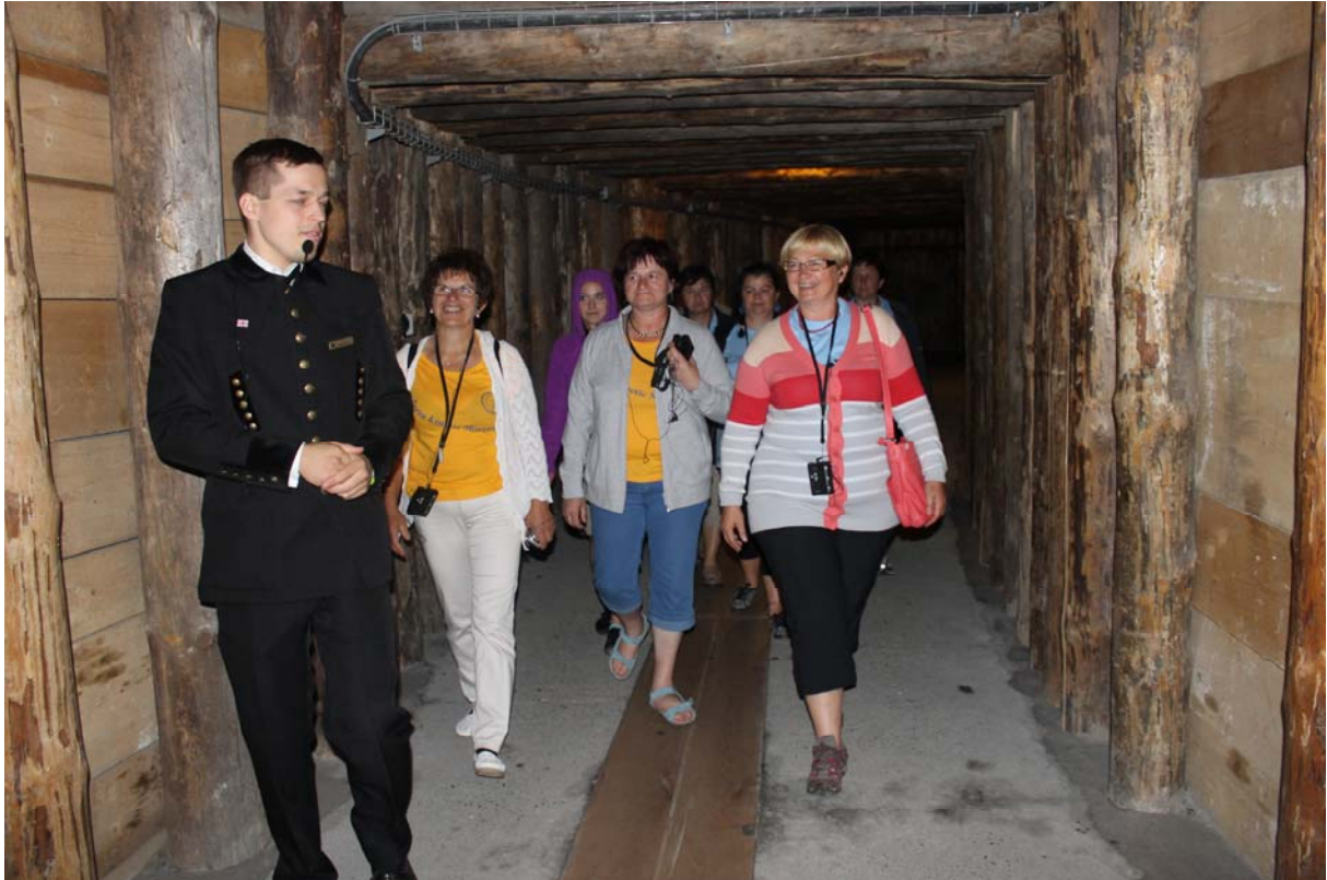
V rudniku soli