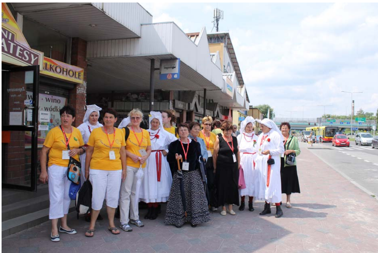
Sprehodi po mestu, iskanje nastopajočih slovenskih skupin