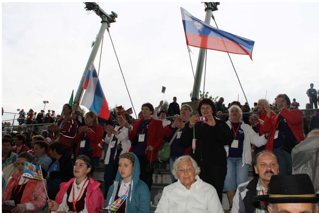
Na otvoritvi so zaplapolale tudi naše zastave...