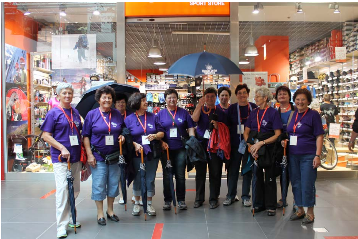
Evo nas, kar dobre volje smo...