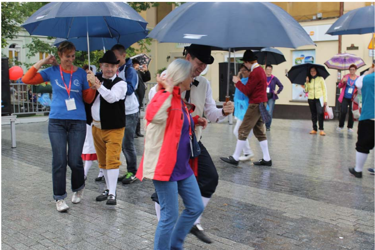
Ulično srečevanje z udeleženci...