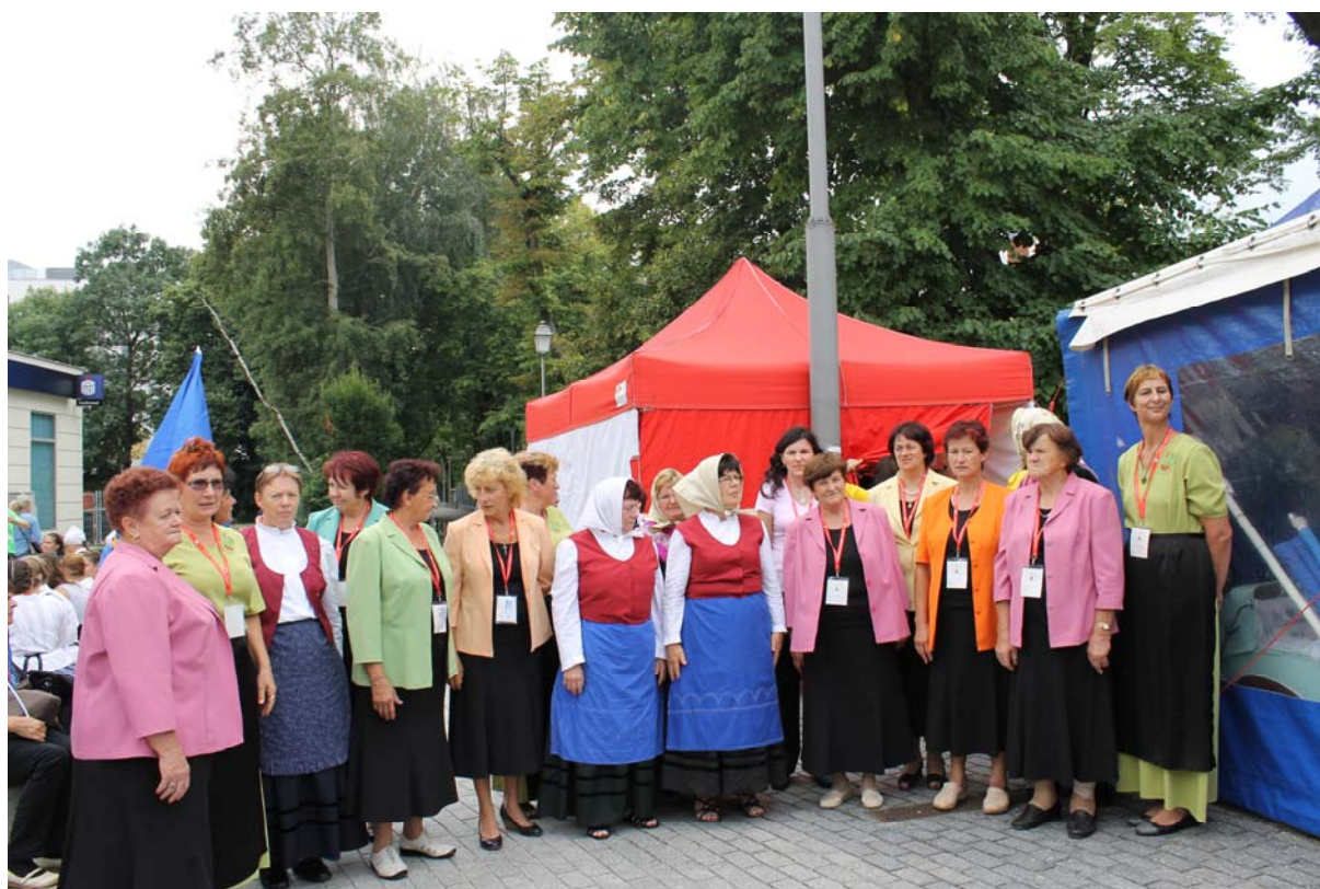
Ulični nastop skupine Zveze kmetov Slovenije