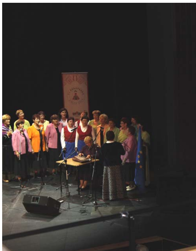
Nastop Zveze kmetic Slovenije v Kulturnem domu