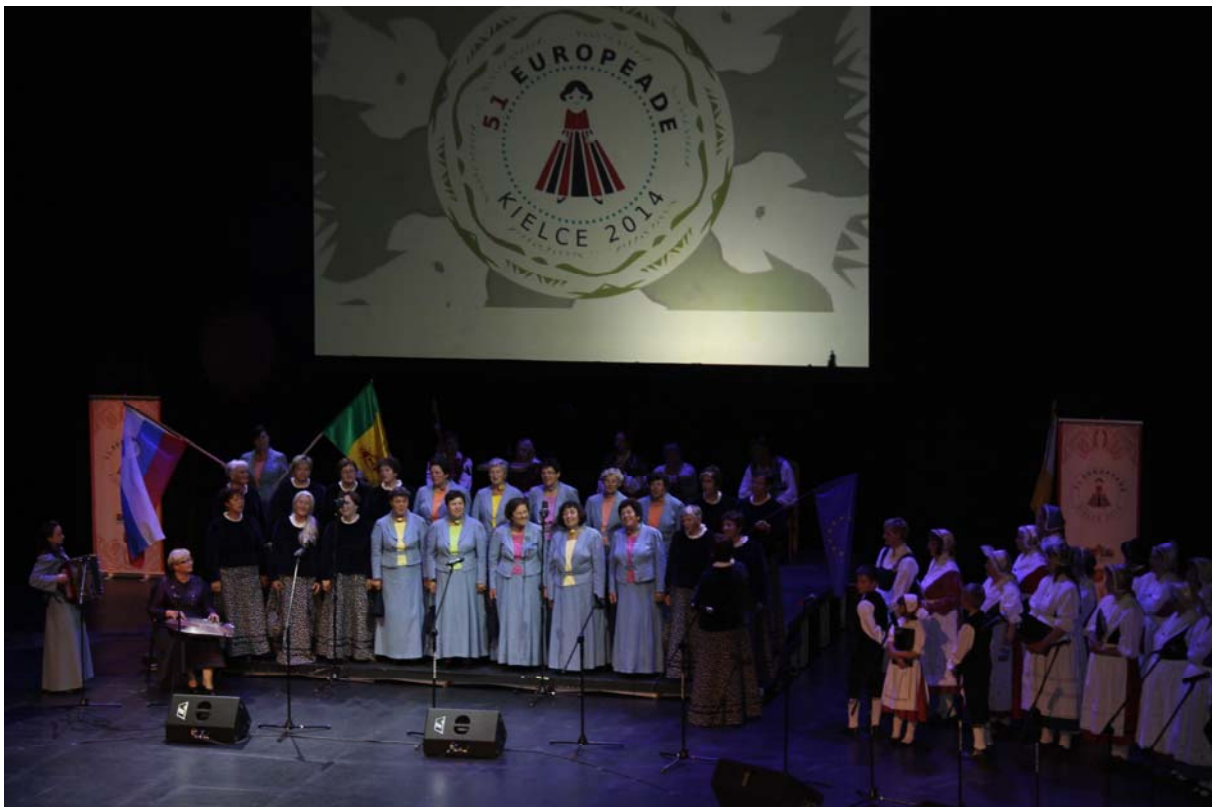
Nastop Čebelice in Klasek v Kulturnem domu