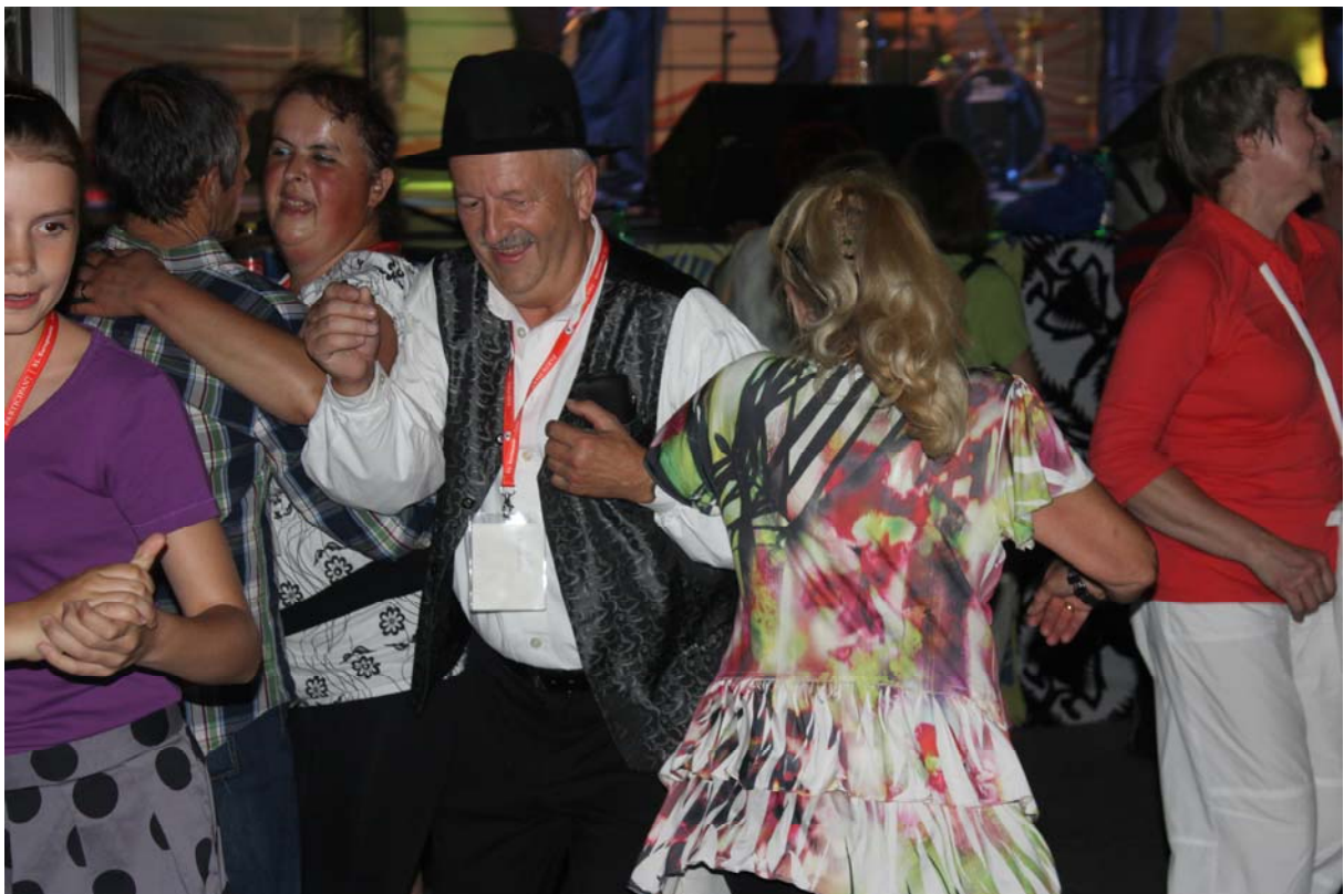
Nočno življenje- cela ulica nori....