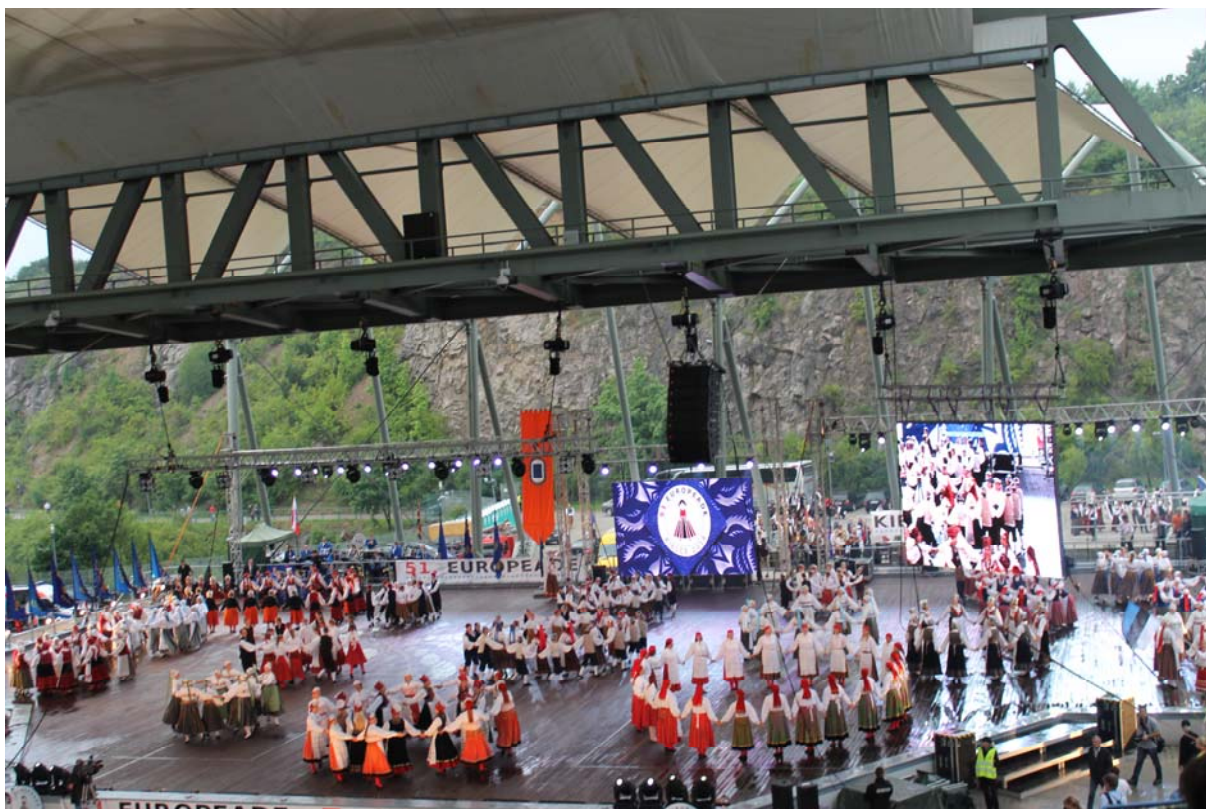
Večer je bil namenjen folkloristom...