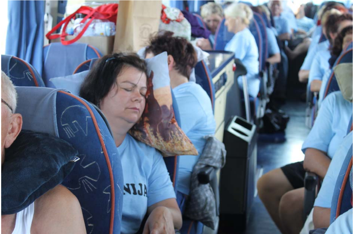
Pa še dolga pot domov.