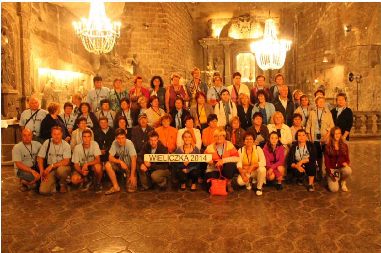
V dvorani v rudniku je zazvenela slovenska pesem